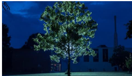
13.000 €/10000 €/7000 € (inv/beheerplan) 5000 €/4000 € (kanskaart) 50% bijdrage in airkoe, klimaatbomen

Een 'middelgrote' gemeente krijgt voor 15.000 à 20.000 € vergelijkbare service als binnen huidige project