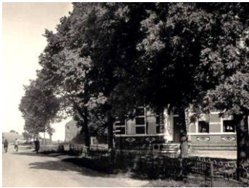
10.000 € forfattair