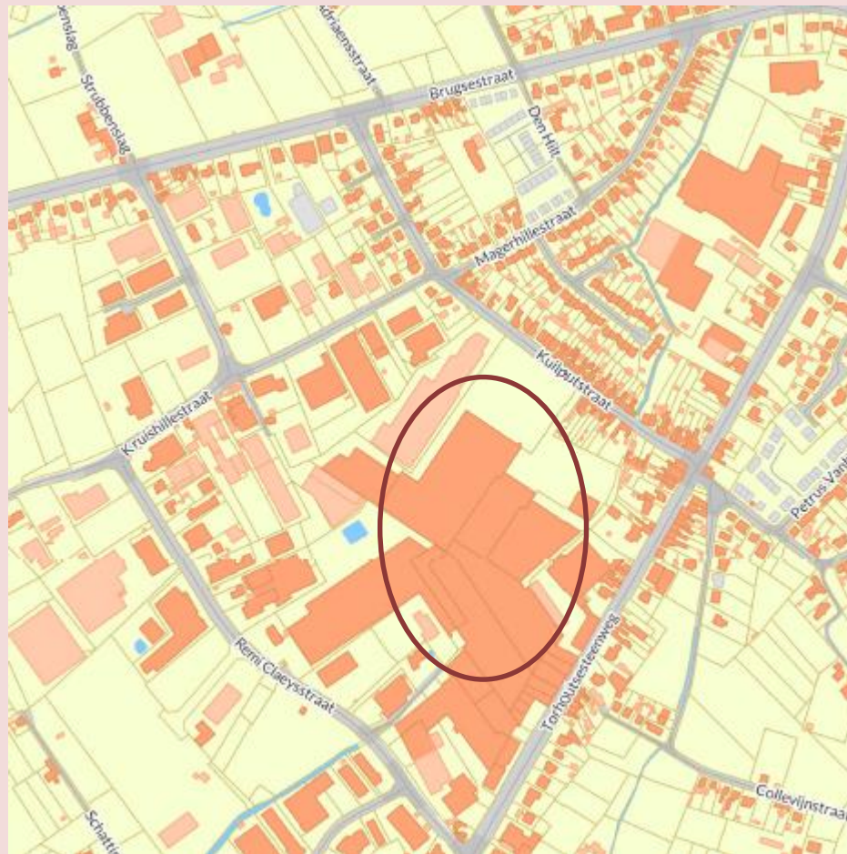
Industrieterrein De Schatting