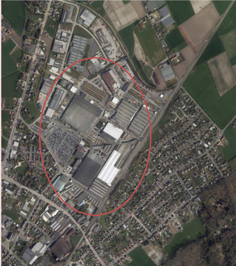
Industriezone De Arend met CNH Industrial