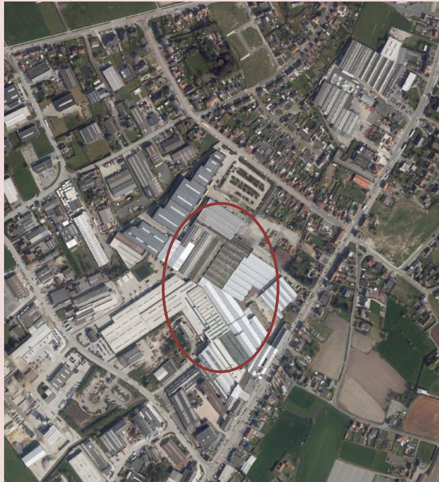
Industrieterrein De Schatting