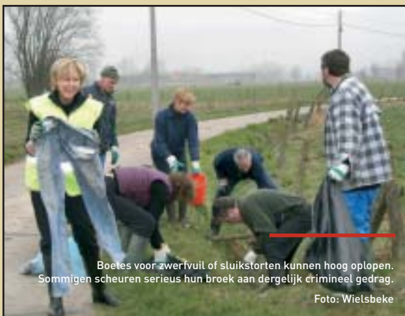
Boetes voor zwerfvuil of sluikstorten kunnen hoog oplopen. Sommigen scheuren serieus hun broek aan dergelijk crimineel gedrag.