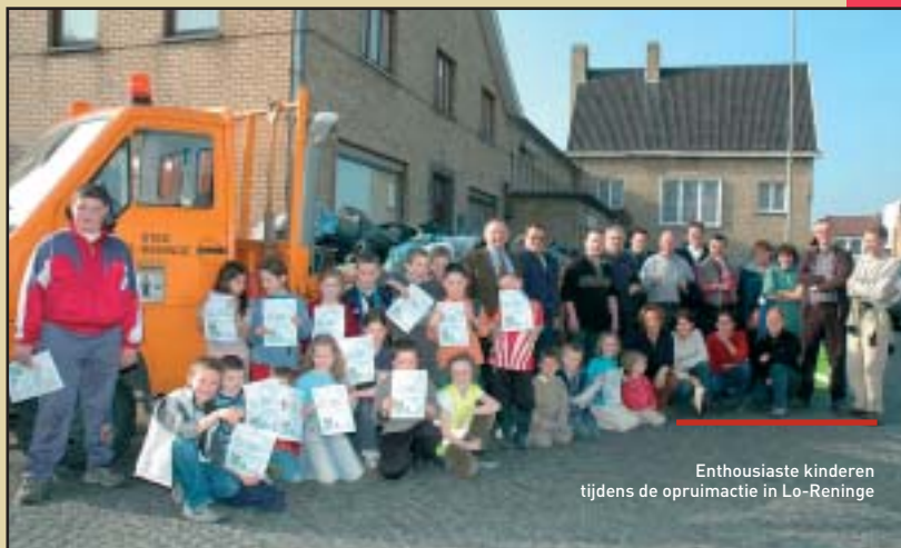
Enthousiaste kinderen tijdens de opruimactie in Lo-Reninge