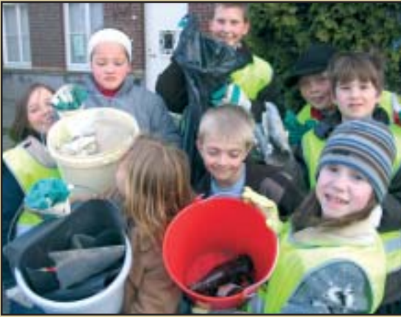
Meer dan 700 schoolkinderen uit Harelbeke en Bavikhove staken op 18 maart de handen uit de mouwen/in de handschoenen.

duizenden kilo's afval in, maar wilden vooral het signaal meegeven dat achteloos afval achterlaten in de natuur en langs de straat eigenlijk niet kan.