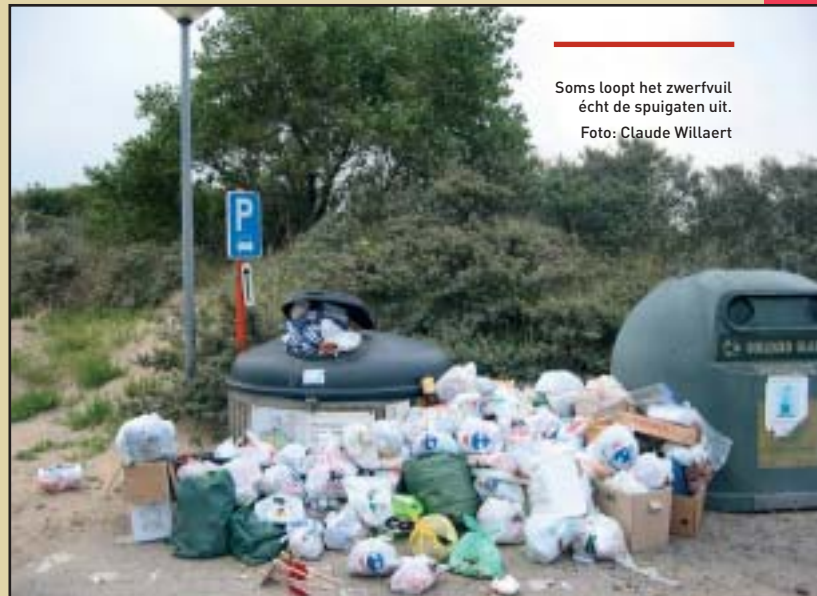
Soms loopt het zwerfvuil écht de spuigaten uit.

Is het de bedoeling om het probleem alleen maar met communicatie aan te pakken? Het antwoord is volmondig 'neen'! Ook betere voorzieningen (bv. vuilnisbakken en blikvangers - maar dan wel oordeelkundig opgesteld en zeker niet te ruim in aantal), meer toezicht , snelle