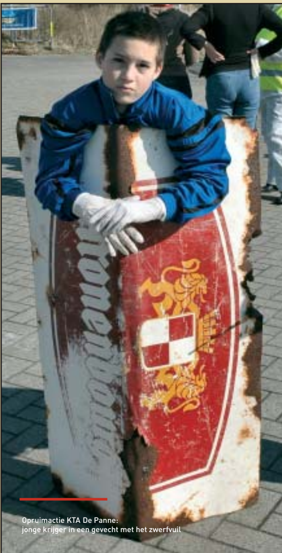
Opruimactie KTA De Panne: jonge krijger in een gevecht met het zwerfvuil

In Lo-Reninge namen 35 vrijwilligers deel aan de actie. Er werden tientallen kilo's ingezameld, waaronder enkele opmerkelijke vondsten zoals een matras, een zetel en een TV.