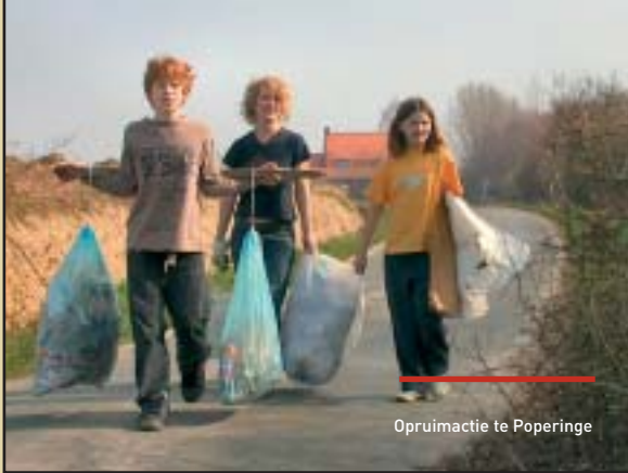
Opruimactie te Poperinge

Voor de zwerfvuilactie in Poperinge kwamen 394 personen opdagen. In totaal werd daar 1.905 kg zwerfvuil geruimd.