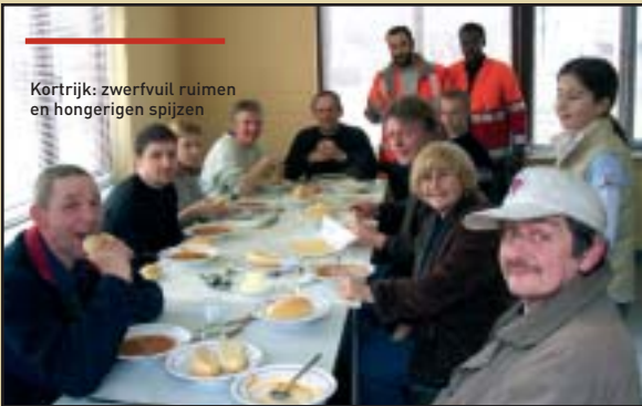
Kortrijk: zwerfvuil ruimen en hongerigen spijzen

Dankzij de ondersteuning van gemeenten en intercommunales is een zwerfvuilopruiming lang niet meer zo smerig als decennia geleden. Handschoenen, grijptangen, zakken en fluohesjes stonden veelal ter beschikking van de deelnemers zodat ze zich na de opruiming zo weer onder de mensen konden begeven.