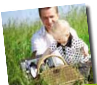
LEUKE ATTENTIE VOOR DE PAPA'S