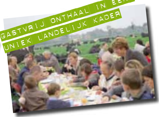
GASTVRIJ ONTHAAL IN EEN UNIEK LANDELIJK KADER