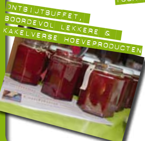
ONTBIJTBUFFET, BOORDEVOL LEKKERE & KAKELVERSE HOEVEPRODUCTEN