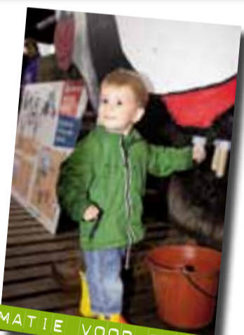
ANIMATIE VOOR DE KINDEREN

Uw inschrijving is pas definitief na overschrijving tenzij anders vermeld. Vermeld uw familienaam + aantal volwassenen/kinderen + voornaam van de papa.