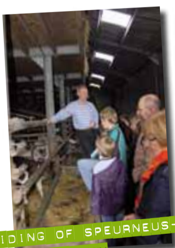
RONDLEIDING OF SPEURNEUS-TOCHT ACHTER DE SCHERMEN VAN DE BOERDERIJ