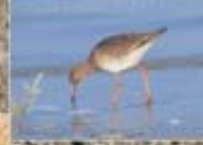
Toreluur Tinga tatarica Chevalier gardien Roodkeel - Curlew Redshank