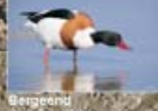
Berggand Tadorna tadorna Tadorna de Balle - Berggand Cormorant