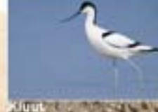
Kluut Recurvirostra avocetta Kluut - Sabelfuut Avocet