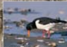
Slijkgaper Hemipodus ostragor Hutheide - Austermus Cysteraltier