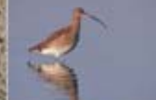
Wulp Numenius arquata Groene reiger - Grosbeak Brachvogel - Eurasian Coturn

Strandgaper Actitis hypoleucos Actitis Sanderling Sanderling